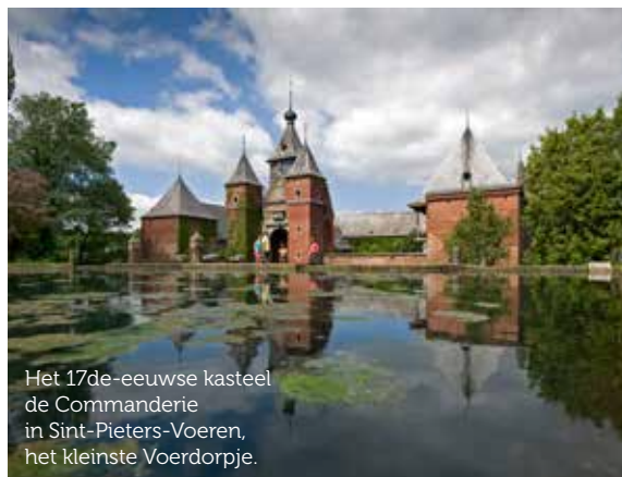
Het 17de-eeuwse kasteel de Commanderie in Sint-Pieters-Voeren, het kleinste Voerendorpje.