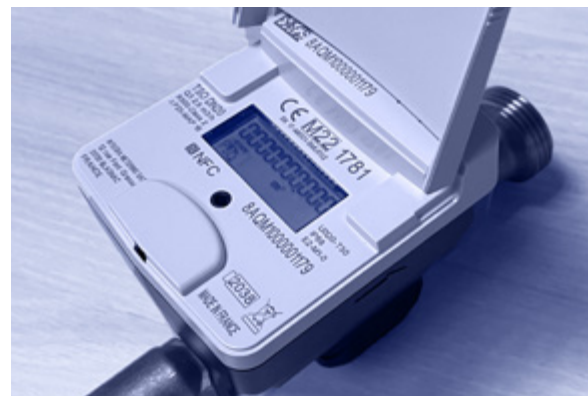
Integra zie pagina 4