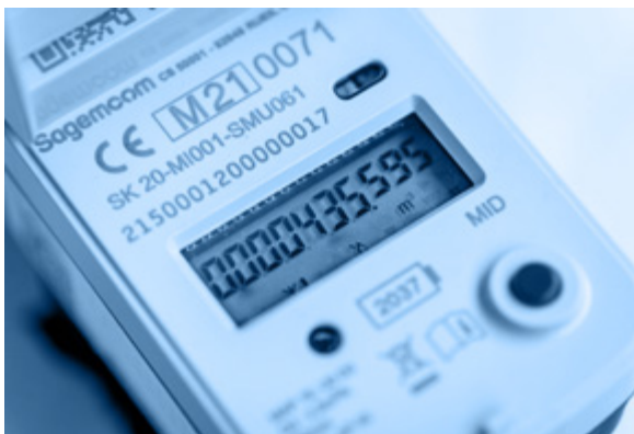
Sagemcom zie pagina 2

Er zijn op dit moment 2 types digitale watermeters in omloop bij klanten van De Watergroep. Je vindt meer info over elk type op de volgende pagina's: